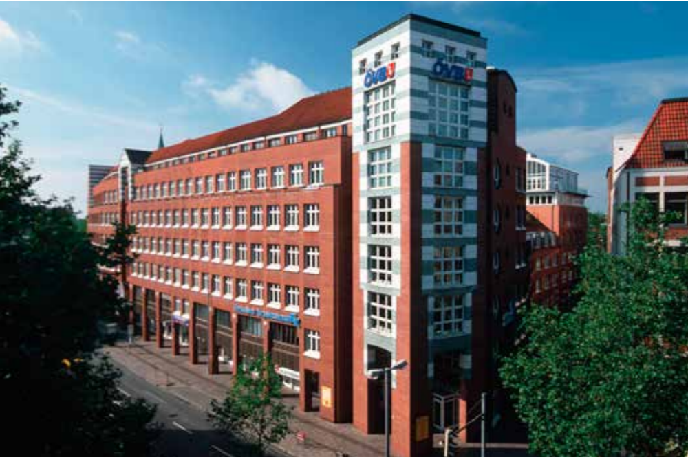
ÖVB Zentrale in der Martinstraße 30 in Bremen